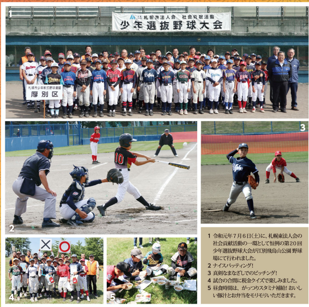
第20回 少年選抜野球大会／江別市飛鳥山運動公園