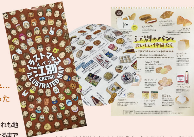
↑ 今や、小麦製品を楽しみながら散歩できる庶民グルメの街江別。

Highly Intensive Plant(小規模高集約型プラント)。Fは、Flour(小麦粉)・Farm(農場)・Food(食べ物)・Fit(ぴったりの)・Fine(素晴らしい)の頭文字)小麦を作る人、粉にする人、パンや麺やお菓子に作り上げる人…小麦をとりまくすべての人たちが、お互いの思いを共有しながら最良のものを作り上げていくことをコンセプトにしたと言います。