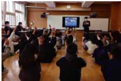
令和2年12月18日(金) 札幌市立南白石小学校