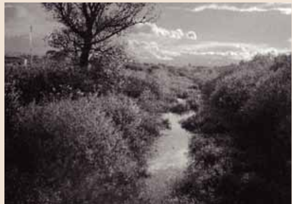
落合橋から見る旧豊平川

その豊平川も間もなく札幌市東区中沼と江別市角山の間で石狩川に合流し、やがて石狩川も石狩市で河口に達し日本海にそそぎます。こうして、札幌市の南端に位置する空沼岳(1,249m)の山頂から東に延びる尾根の630m峰の西側から回り込むように始まった厚別川の流れは、札幌で豊平川に次いで2番目に長い総延長41kmの旅を終えます。