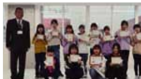
札幌市立南白石小学校

コロナ禍の影響から限られた学校での表彰式でしたが、受賞の皆さんは嬉しそうでした。