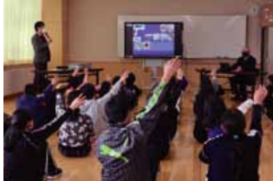
令和2年12月15日(火) 江別市立江別第一小学校

税の勉強が2学期後半から1学期前半に変更されたことから、春に予定が集中しましたが、コロナ禍の影響で秋から冬にかけての開催となりました。