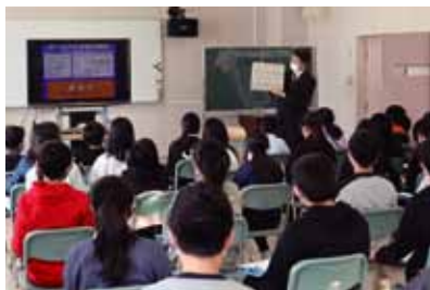
令和3年1月20日(水) 札幌市立厚別東小学校