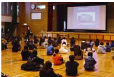
令和3年2月17日(水) 札幌市立北郷小学校