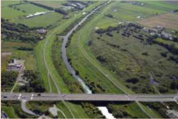
「角山橋上空から厚別川上流方向を望む」

札幌東法人会の管内を流れる一級河川「厚別川」は、支笏湖の近くにそびえる空沼岳に端を發し、南区の滝野すずらん丘陵公園内のアシリベツの滝を経て、鱒見の滝・鱒見の沢を合わせて清田区へ入り、真栄で羊ヶ丘通をくぐって北野を抜け、東北通りに至り、いよいよ札幌東法人会の管内に入ってきます。