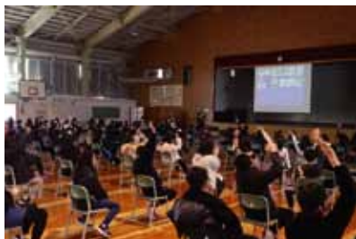
令和2年12月25日(金) 札幌市立立川北小学校