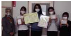
江別市立大麻泉小学校