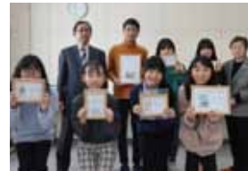
札幌市立北郷小学校