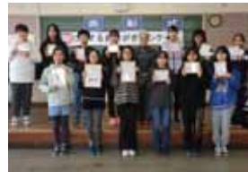
江別市立大麻泉小学校

会場内には受賞された生徒やご家族など多くの見学者で賑わいました。また、絵はがきコンクールに応募いただいた方へ参加賞と、優秀賞・佳作・努力賞に輝いた生徒さんへの表彰状を各学校へ持参しました。