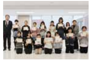
札幌市立本通り小学校