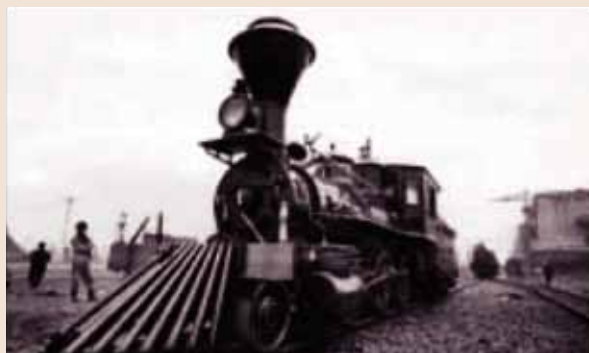
札幌・幌内間を走った義経号

年間295万人の乗降客が利用している現在のJR白石駅ですが、その前身の開業は明治15年11月13日の幌内炭鉱全線開通に遡ります。明治39年10月1日北海道炭礦鉄道の鉄道路線国有化により、鉄道院(国鉄)に移管、地域産業の栄枯盛衰とともに紆余曲折しながら現在の姿になるまでのお話です。