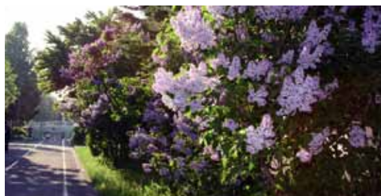
ライラックの花と白石こころーど