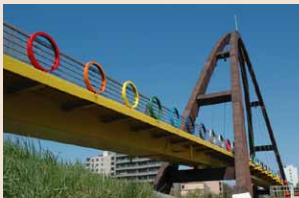
厚別川に架かる虹の橋(札幌市白石区南郷通21丁目南)

旧国鉄千歳線跡地は、サイクリングやジョギング、犬の散歩などを楽しむ多くの人が行き交う、区民に親しまれる憩いの場所となっています。